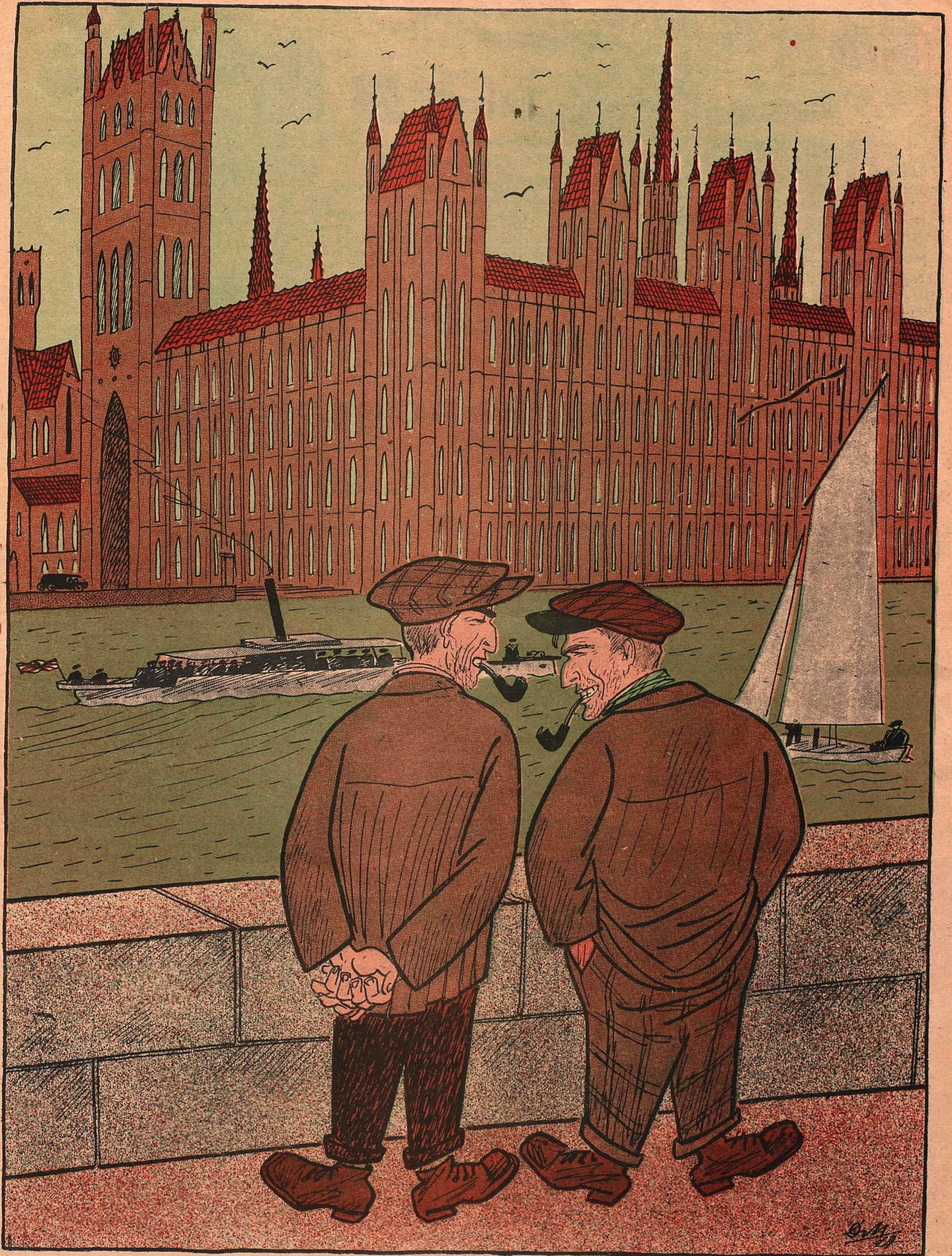
Рис. Д. Мельникова