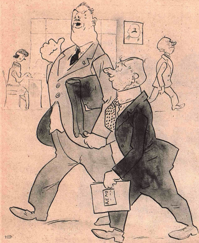
Рис. Ю. Ганфа

ЗАВ: — Скажите, как фамилия этого бывшего нашего служащего?