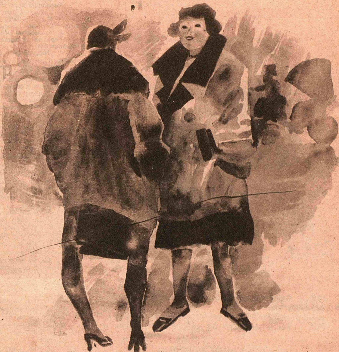
Рис. Ю. Ганфа

— Ваш муж партийный? — Нет, оппозиционер.