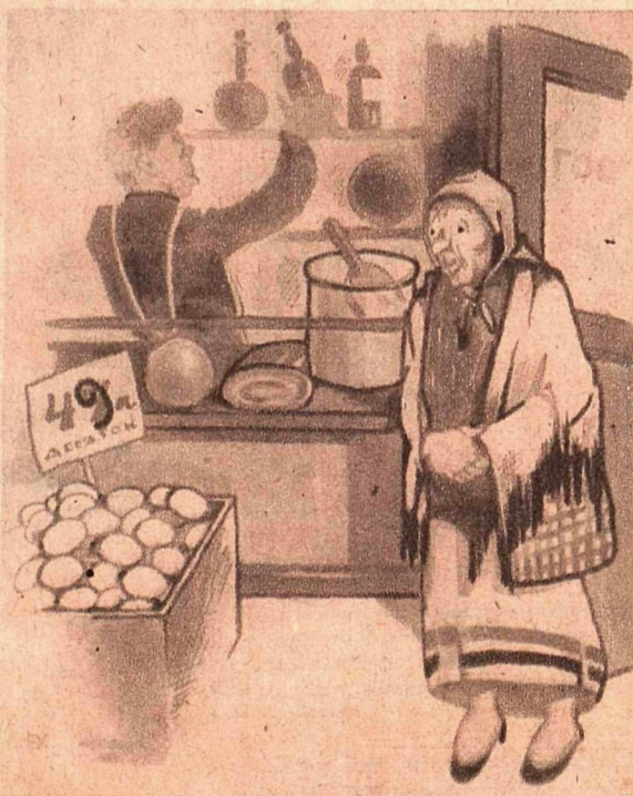
Рис. К. Хомзе