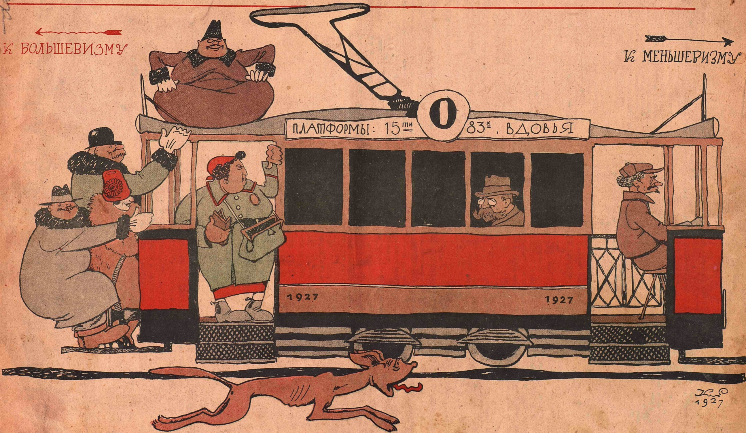
АНТИСОВЕТСКИЙ ЭЛЕМЕНТ:— Хоть и без билетов, но как-нибудь доедем,—нам эта линия по пути!..