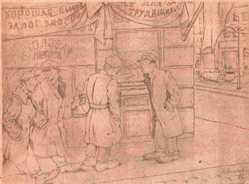
Рис. А. Малеинова

— Самоубийцам—и тем амнистию для праздника дали: нарпитовскую столовую нынче не открывают.