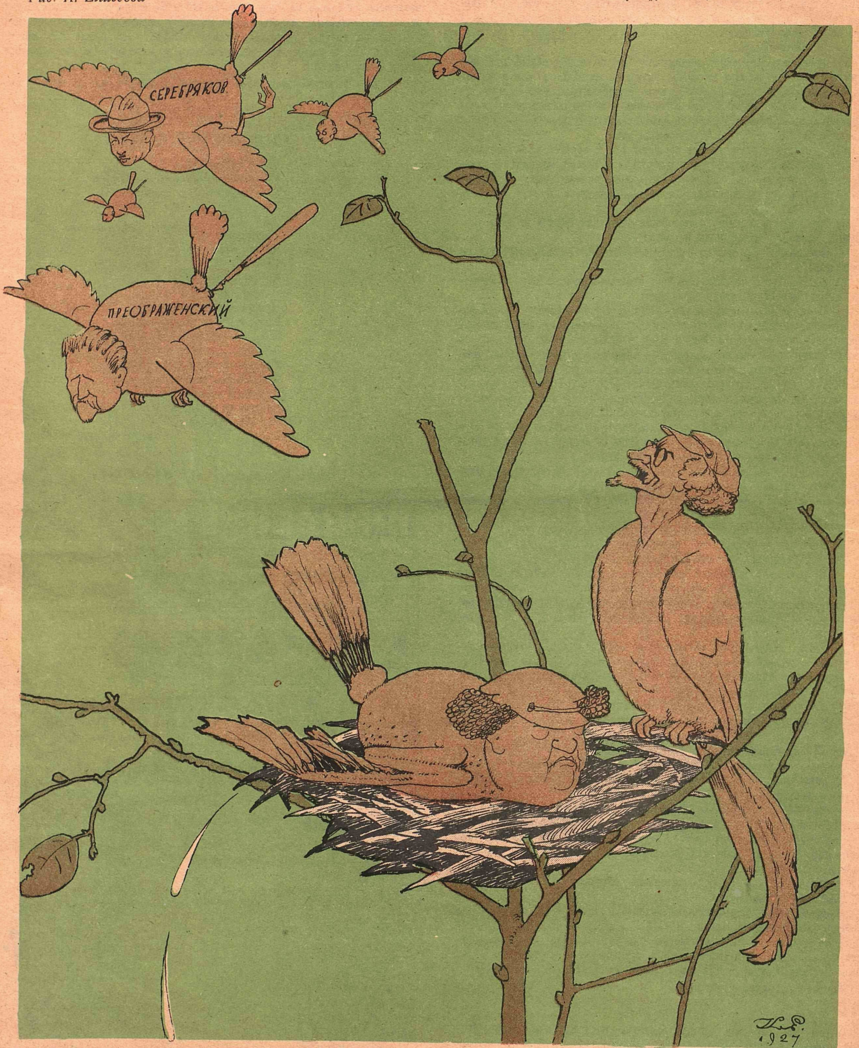
Рис. К. Елисева

ТРОЦКИЙ: — Гляди-ка! Птенцы-то уже оперились и вылетели!.. ЗИНОВЬЕВ: — Из гнезда? ТРОЦКИЙ: — Нет, из партии.