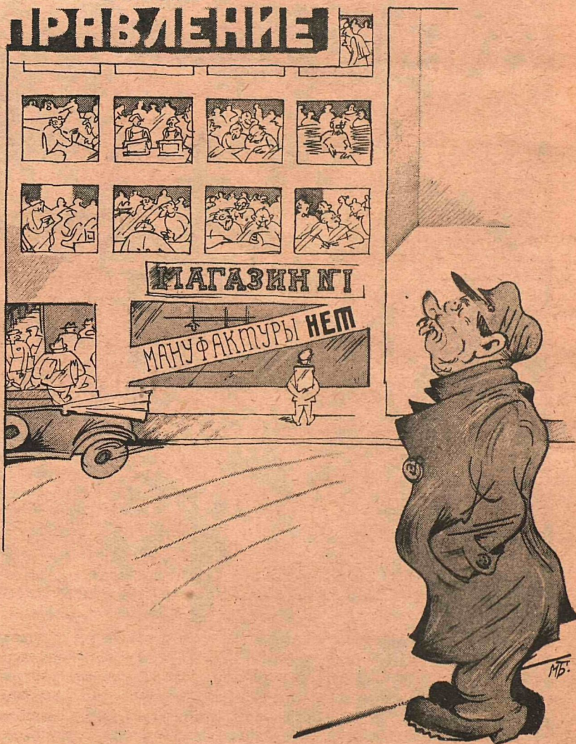
Рис. М. Бабиченко

ПОТРЕБИТЕЛЬ:— Сколько народу в правлении работает, а мануфактуры достать не могут.