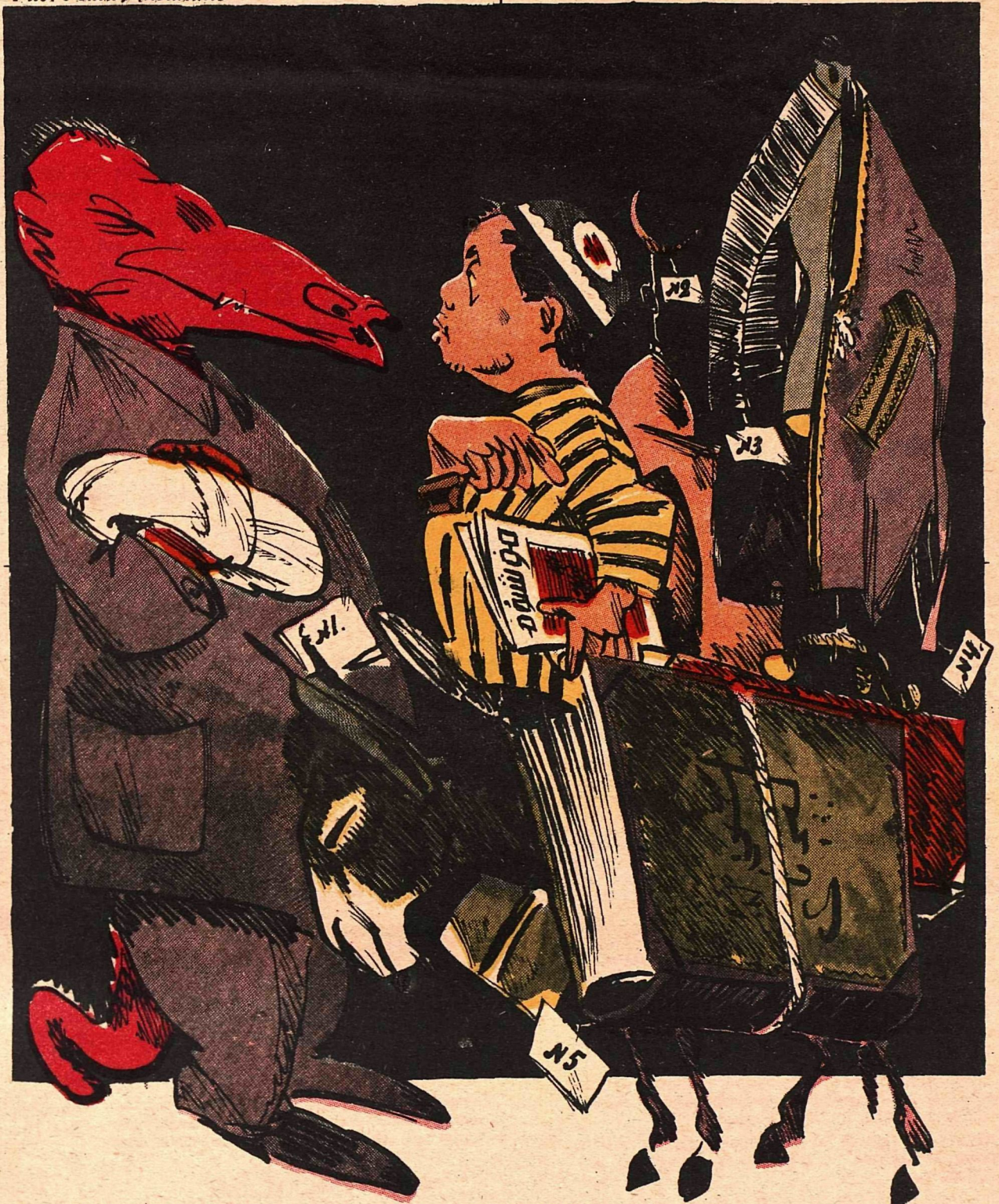
Узбекский сатирический журнал „МУНТУМ“ в день пятилетия своего существования прислал старшему брату своему по сатире „КРОКОДИЛУ“ привет и этот рисунок с трофеями пятилетней борьбы: 1) чалмой, 2) мечетью, 3) паранджей (женским покрывалом), 4) чадрой и 5) кораном.

Понедельник. С 9 — 12 доклад в Наркомате. С 12—1 работа по должности. С 1—4 заседание комиссии по... (наименование комиссии, существующей или вымышленной). С 4—7 работа на дому (просьба не отрывать и не беспокоить!). С 7—12 заседание в... (название учреждения или организации).