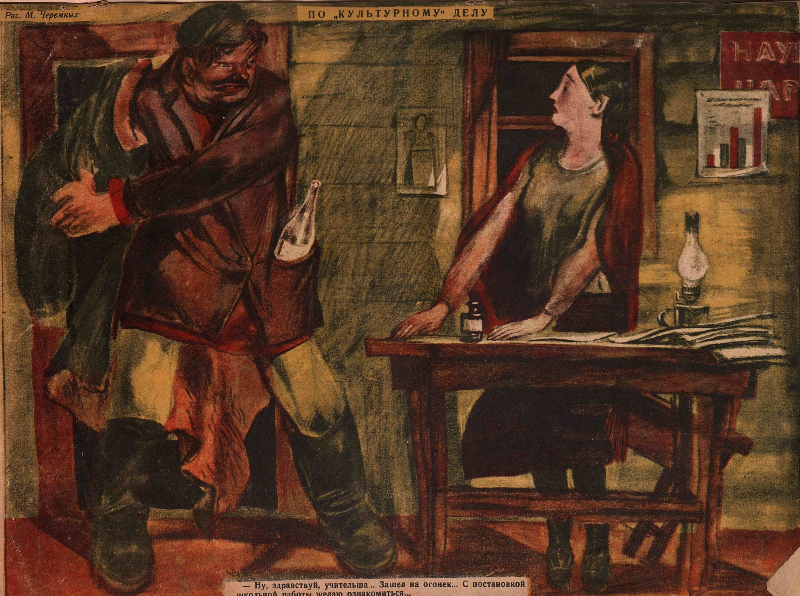
— Ну, здравствуй, учительша.. Зашел на огонек... С постановкой школьной работы желаю ознакомиться..