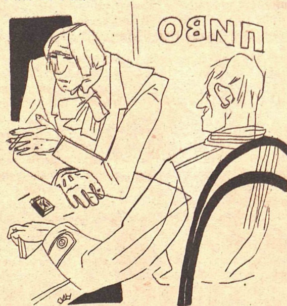
Рис. В. Гин

— Недаром все находят, что я на Толстого похож!