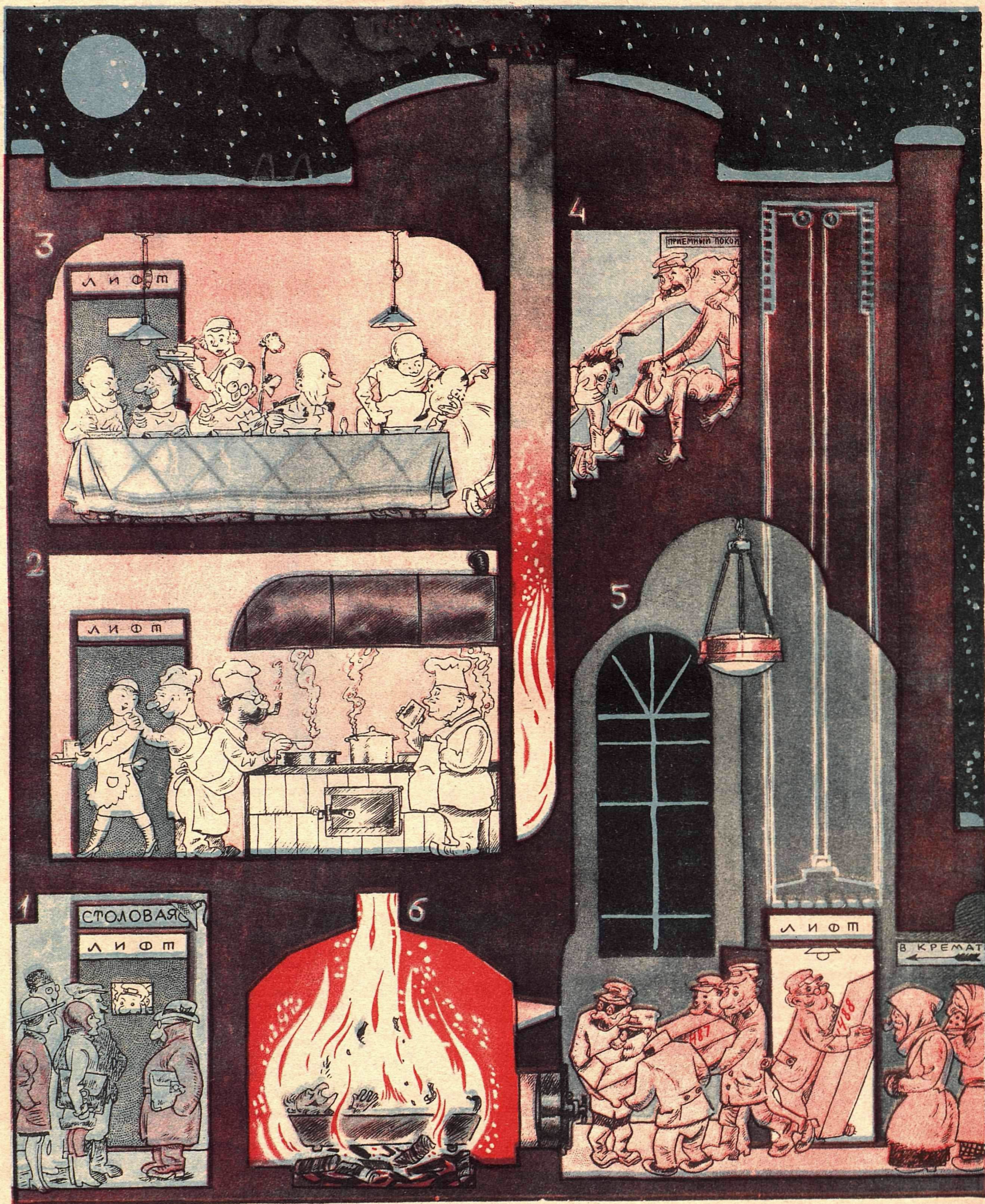
Рис. К. Ротова

К ПРОЕКТУ („КРОКОДИЛА“) ОБЪЕДИНЕНИЯ КРЕМАТОРИЯ С ДЕШЕВОЙ СТОЛОВОЙ