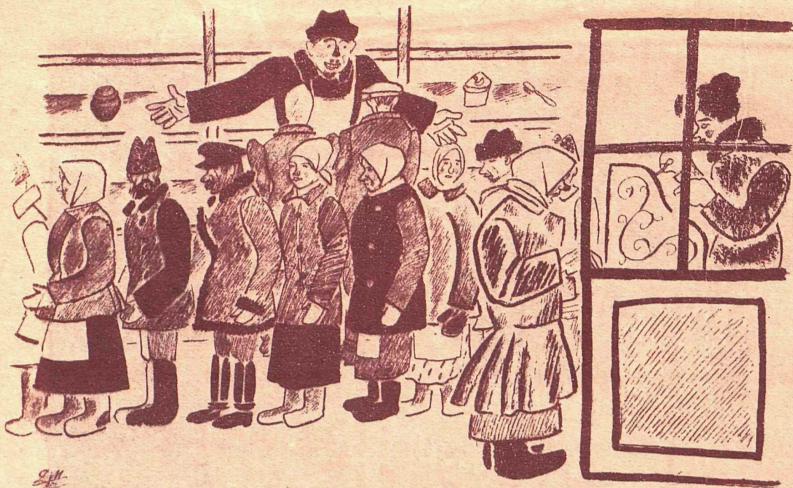
Рис. Д. Мельникова

— Чудно! И продавцы, и касса свободны, а очередь стоит... — Ничего не чудно,—к жалобной книге стоит эта очередь.