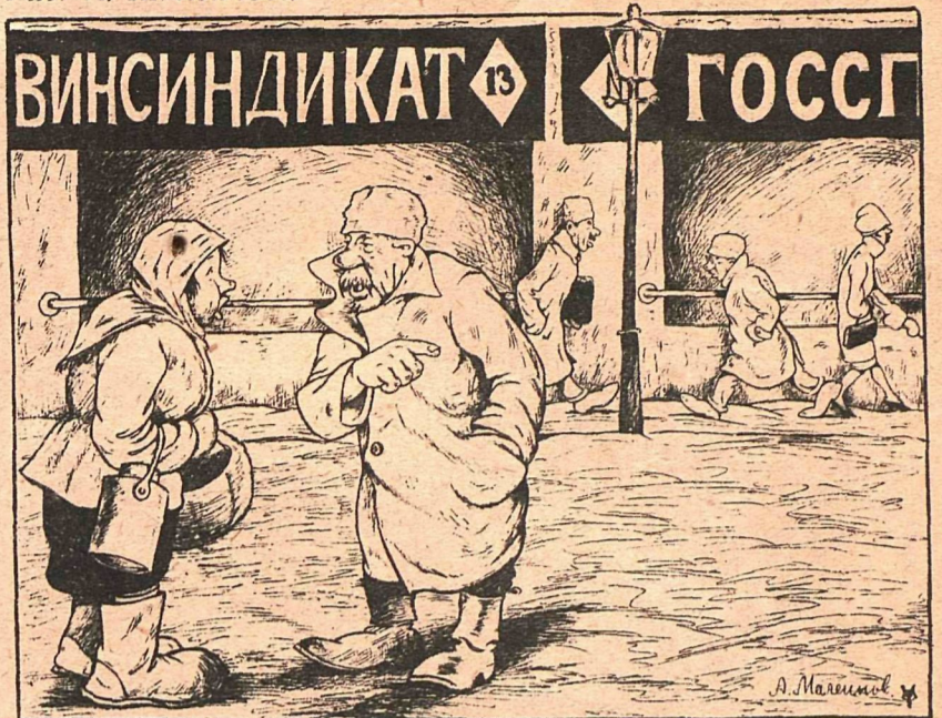
Рис. А. Малеинова