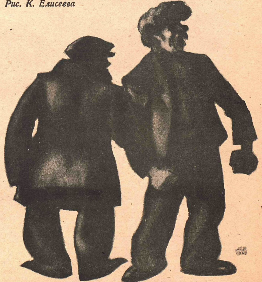
Рис. К. Елисеева