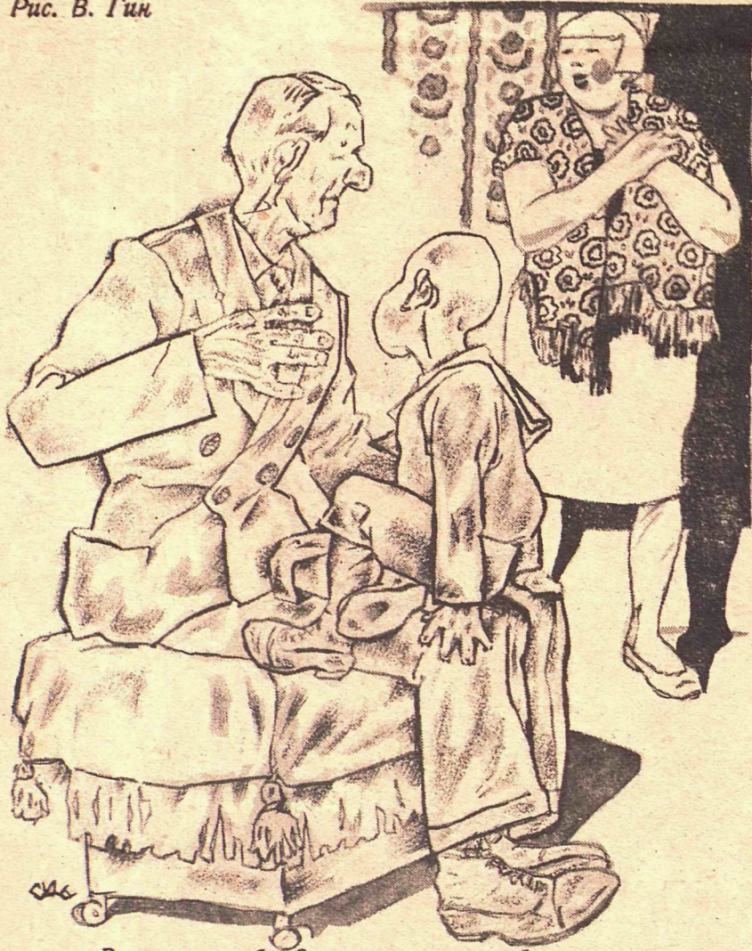
Рис. В. Гин