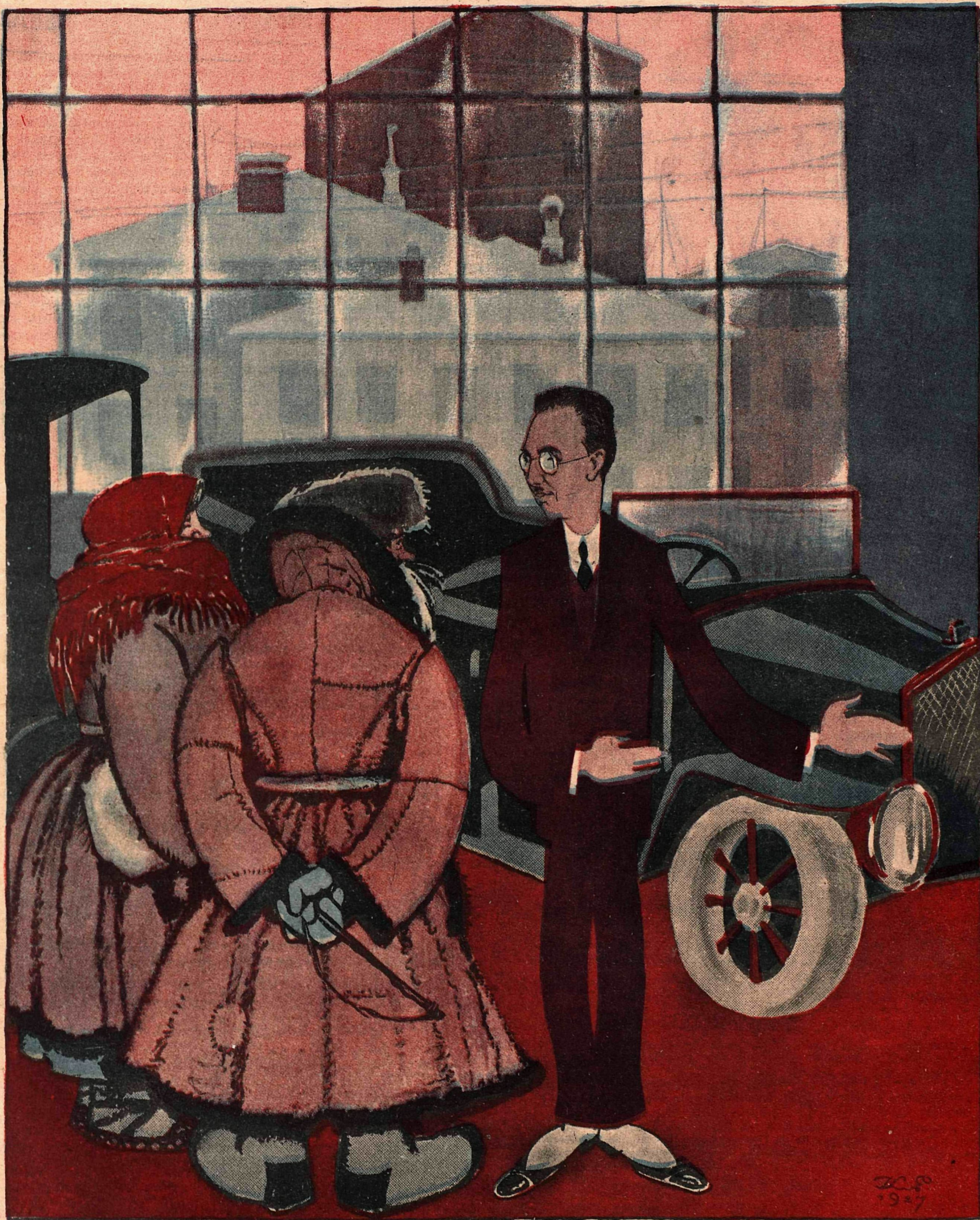
Рис. К. Елисева

— Вам что?! Хотите „Фиат“, „Бенц“, „Форд“, „Хорх“?! Есть последние модели.. — Нет, милый, — нам бы мази колесной..